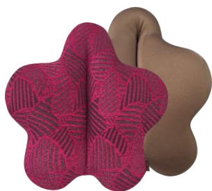
デュカートピンク