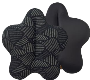
デュカートブラック