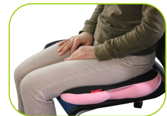
お尻を落として手を離す...心地良いフィット感！ キュツ！と左右の引き締め感！