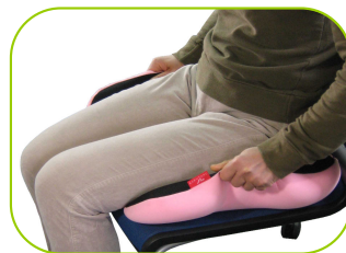
お尻を少し浮かせて左右に引張る ※前より左右で前傾斜 後より左右で後傾斜 中央左右でフラット