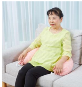
ソファに座っている ときの腰用サポート クッションとして