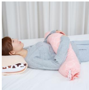
寝ているときの 腕置きクッションと して