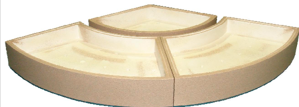
セクターベース φ2,760(90度×200h) 価格116,000円