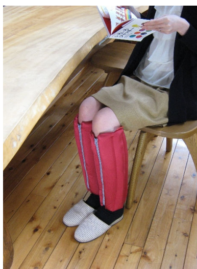
足回りはすっきり。つけたままお歩きください。