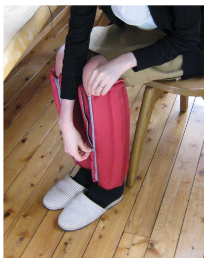
装着／オープンファスナーにより簡単に装着できます。

機能性ビーズクッションのリーディングブランド『Cubeads(キュービーズ)』！ この冬のウォームBIZ・必須アイテム「あったかシリーズの最新作」です。 足に巻きつけ、ファスナーを上げるだけで簡単に装着。発泡ビーズの優れた保温力により、足首からふくらはぎの冷えを一気に解決します。 屋内でも屋外でもバツグンの暖かさを発揮します。